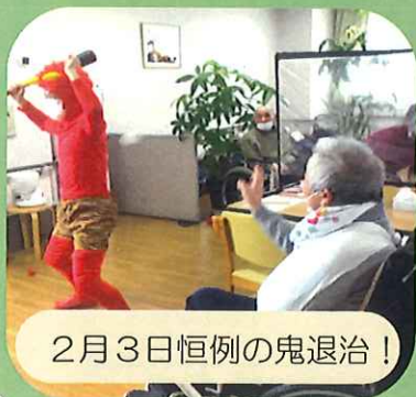
2月3日恒例の鬼退治！