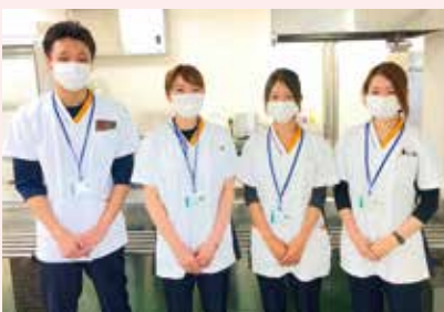
“チーム栄養科”の皆さん

長年着用してきました白衣でお馴染みの栄養科のユニフォームが8月より新しくなりました。新たなユニフォームは清潔感に溢れる白色を基調に、さり気ないオレンジラインと紺色の配色がお洒落な美しいデザインになっています。素材も伸縮性抜群のものを使用しているので動きやすく、ポケットも多いことから機能性にも