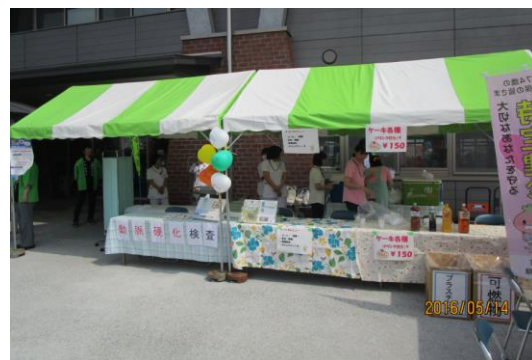
昨年の参加の様子

去年初めて川島病院と平成の森(老健)は福祉祭りに参加させていただきました。病院はまた動脈硬化(血管年齢)測定器をフクダ電子に依頼し準備しました。去年は時間の関係もありお断りした方もございましたので再度測定したいと思います。健康管理のためにもご自分の血管年齢をご確認ください。平成の森(老健)は温かい汁ものをつくりお待ちしております。